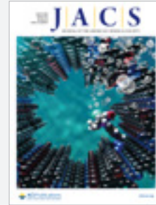
Journal of the American Chemical Society